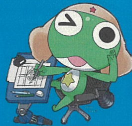
「吉崎敦史/角川」 應援角色 Keroro軍曹