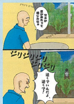
1頁漫畫【高中組】(Distance·距離) 作品名:夏天的距離感 筆名:NATATEKOKO