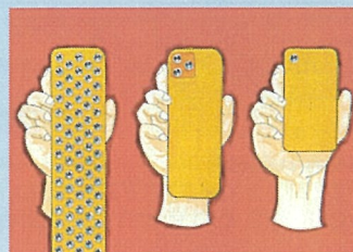
1頁漫畫【一般組】(成果・距離) 作品名:智能手機的終結 筆名:KOUTA的頻道