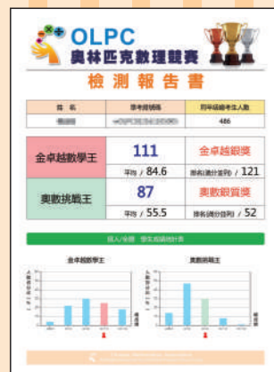
多種專業統計圖表 進行大數據分析